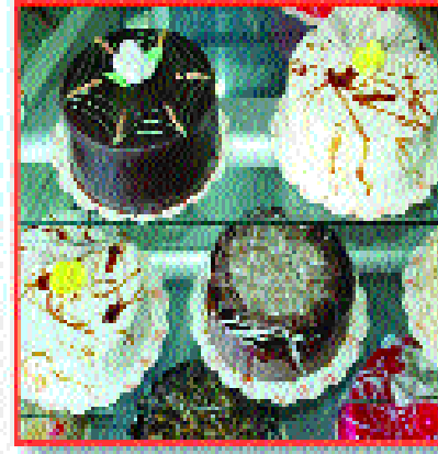
Pasta ve Tatlı Çeşitleri